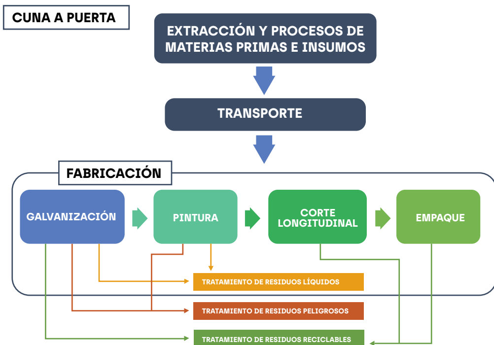
Diagrama del Proceso Productivo