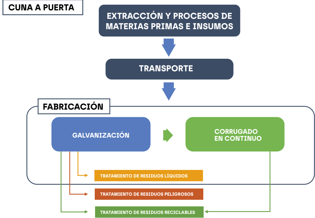
Diagrama del Proceso Productivo